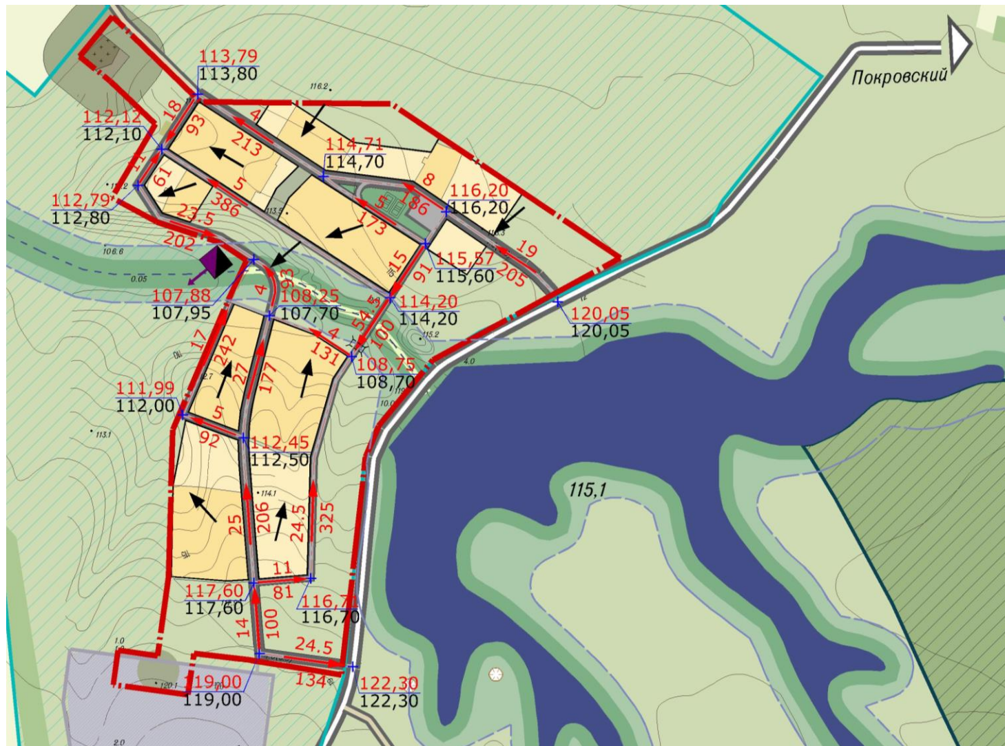
Схема инженерной подготовки и благоустройства х. Ленина